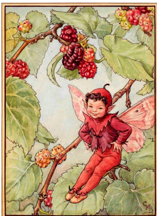
Cicely Mary Barker, « The Mulberry Fair », dans The Fairies of The Trees .

L'illustratrice britannique Cicely Mary Barker et le peintre suisse Ernst Kreidolf ont fortement inspiré l'univers du spectacle « Dans la forêt, il y a... ». Fées, fleurs et cycles saisonniers, la nature revêt un rôle essentiel dans leurs œuvres et les deux artistes réussissent, chacun à leur manière, à dépeindre avec délicatesse son côté mystérieux et fantastique.